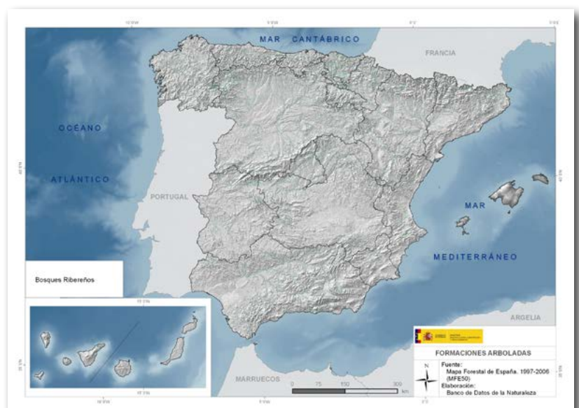
Mapa de distribución del aliso