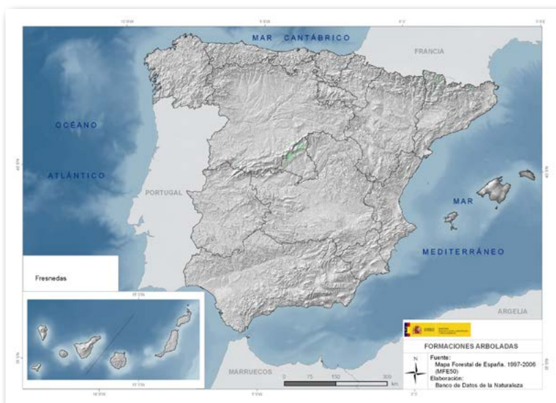
Mapa de distribución de fresnedas

Distribución geográfica: norte de la Península desde Galicia hasta los Pirineos y Sistema Central.