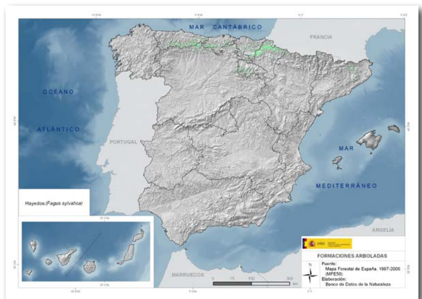
Mapa de distribución de hayedos